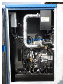
ディーゼルエンジン